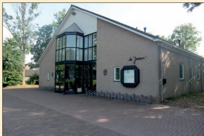
dorpshuis 'De Jister'