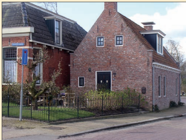
huis op hoek Achterwei - Grutte Loane

Inzetten op bestaande bouw en afronden mogelijkheden voor nieuwbouw in Ee