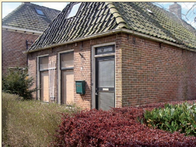
huisje aan de Omgong