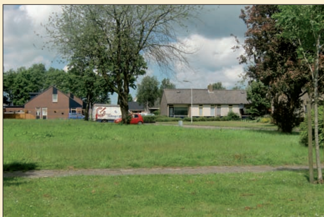
braakliggend bouwterrein aan de Skeperij