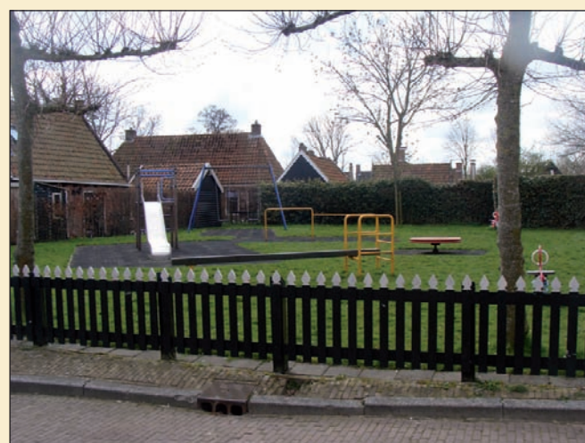
speelsterrein aan de Lytse Loane